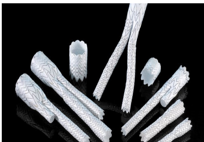
図1 実際のステントグラフト