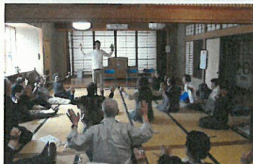
6年5月25日 出前講座(リハビリ) 「介護予防」